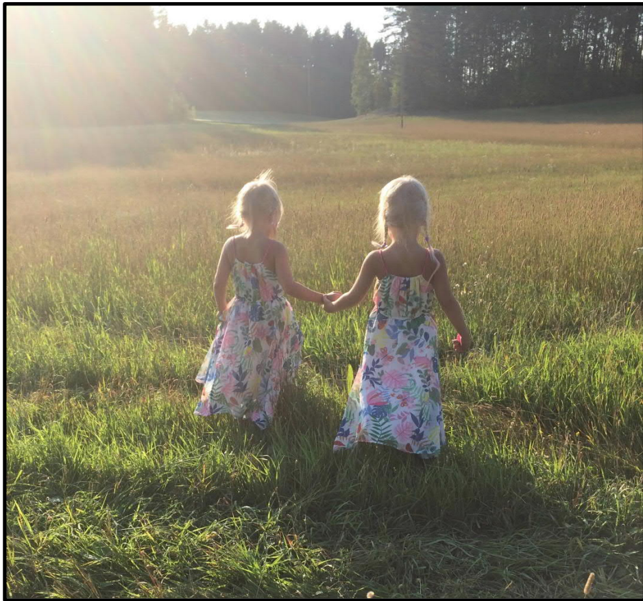
Yhdessä käsikkäin tulevaisuutta kohti