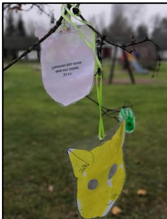
"Leikkiminen äidin kanssa tekee minut iloiseksi"