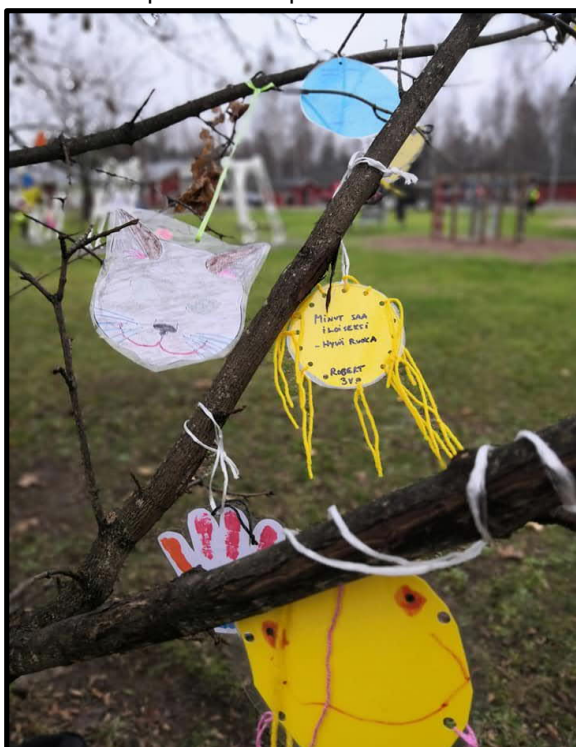
"Minut saa iloiseksi – Hyvä ruoka"

Lemin vapaa-aikatoimi sekä varhaiskasvatuksen ja isot ja pienet juhlistivat maakunnallista METKAT-lastenkulttuuriviikkoa 13.-20.11 pohtien iloa tuottavia asioita näiden haastavien aikojen keskellä. Ilonaiheita saattoi bongata kirjaston puistosta ja sinne sai käydä kuka vaan lisäämässä omansa. Onnellisuus piilee usein pienissä asioissa.